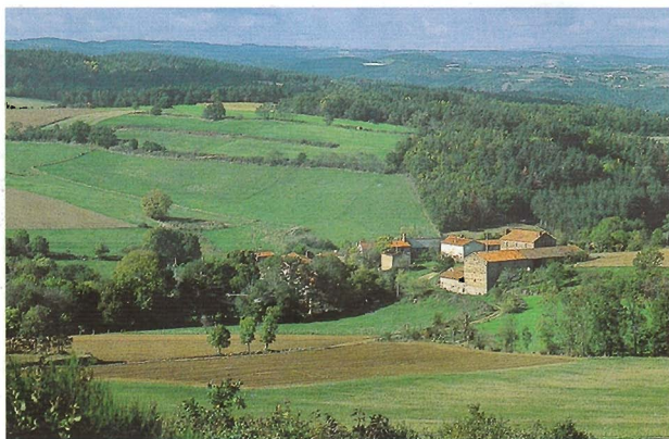
L'Hermet vu depuis le Mongebrout.

D Du parking, devant la mairie, emprunter la route qui passe à gauche (église avec clocher à peigne, fontaine, tour romaine). Après les dernières maisons, suivre le premier chemin à gauche (vue sur Paulhaguet, le Chaliergue et le haut Allier). 1 Aux première et deuxième fourche monter à droite. 2 Au croisement, continuer en montant à droite. Au chemin perpendiculaire, tourner à droite. Peu après, monter fortement à gauche pour atteindre le sommet du